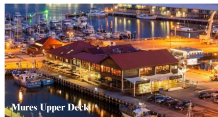
Mures Upper Deck