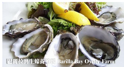
巴麗拉灣生蠔養殖場 Barilla Bay Oyster Farm