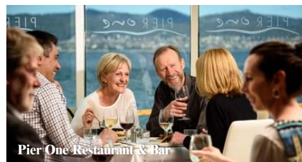
Pier One Restaurant & Bar