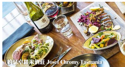
約瑟卓羅米酒莊 Josef Chromy Tasmania

品嚐最鮮味的 Pacific 生蠔，讓每個味蕾都充斥著新鮮甘甜味道，回味無窮！而仿如臉蛋般大的鮑魚更是讓人垂涎三尺！塔斯曼尼亞的野生鮑魚出口量佔全球若 25%，大多生長於荷伯特以西，毫無污染、潔淨清純的南太平洋海域。