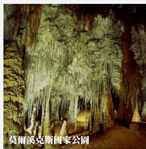
莫爾溪克斯國家公園

位於芬瑟涅國家公園內的酒杯灣瞭望台名列世界十大名灘之一，弧度彷彿就像酒杯圓滑，恍如天公放下的酒杯，令人陶醉在景觀之中，頗有「醉翁之意不在酒，在乎山水之間」的意境。登上瞭望台，湛藍的水質只是遠眺已叫人沉醉。