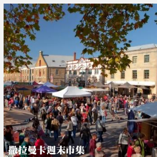
撒拉曼卡週末市集

每到星期六，遊客可在市集內購買各式各樣的產品，是購買手信的好地方，如近年熱爆的薰衣草熊、黑松露產品、橄欖油肥皂、僅塔省獨有的候恩松木製品(Huon Pine Wood)和革木蜂蜜(Leatherwood Honey)等都是購買手信必備之選。