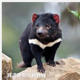
波諾隆野生動物園