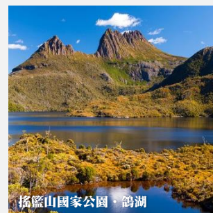
搖籃山國家公園·鴿湖