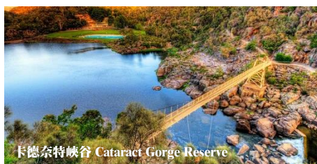
卡德奈特峽谷 Cataract Gorge Reserve

South Esk River 劃開了激流峽谷，切割成峭壁，河岸的南側是岩壁，北岸則是蒼綠的樹林，兩岸不同的風光，交映成壯麗的景色，十分撫慰人心。欣賞峽谷美景之餘，也能走走吊橋、或乘坐世界上最長(近 300 公尺)的單軌纜車，從高處俯瞰峽谷全景，更是別有一番風味。美麗的孔雀及 七十幾種當地的野生鳥類隨時都會出現，帶給您意外的小驚喜。