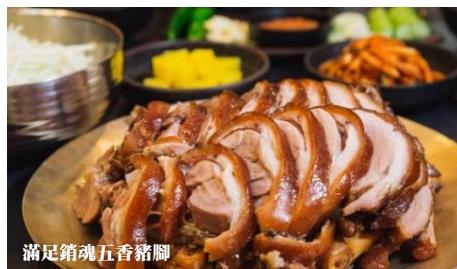
滿足銷魂五香豬腳