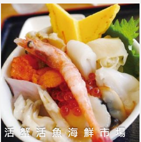
活蟹活魚海鮮市場