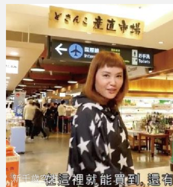
新千歲空港這裡就能買到，還有