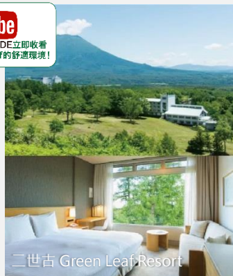
二世古 Green Leaf Resort