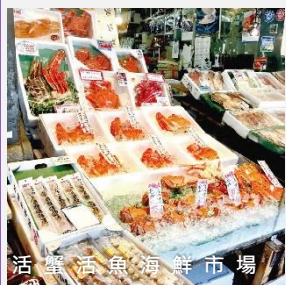
活蟹活魚海鮮市場