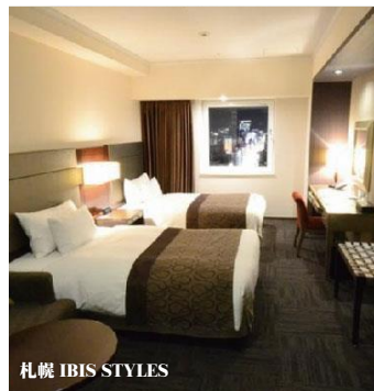
札幌 IBIS STYLES