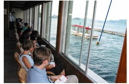
如風試玩過的海女表演