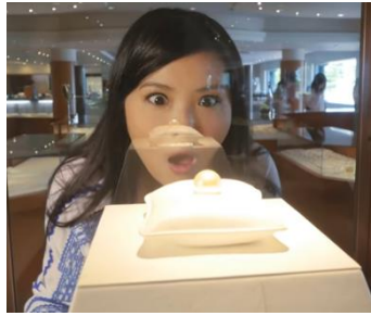
如風都讚嘆的國際品牌「MIKIMOTO」

御木本真珠島是在世界上首度試驗成功珍珠養殖方法的島嶼，御木本幸吉的品牌「MIKIMOTO」更是英國王室、日本皇妃等貴族名媛的愛用飾品。真珠島上有陳列展示以珍珠作成的藝術珍品及可以觀賞珍珠的養殖過程的「珍珠博物館」、介紹御木本幸吉的生涯及功勞的「御木本幸吉紀念館」、擁有販賣珍珠等的商店和餐廳的「珍珠廣場」等。更有機會欣賞海女採貝殼的表演(約10分鐘)，海女穿著稱為「磯著」的全白潛水服，單憑著屏著呼吸，潛水到海底採珍珠貝殼，難度十分高超。備註⑥