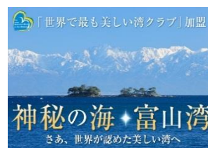
最美麗海灣・富山灣

富山灣經聯合國教科文組織下的「世界最美麗海灣組織正式審定通過登錄為「世界最美麗海灣」之一（全球有 38 個，富山灣為日本第二個）。特地安排前往海王丸公園，伴隨著高 46 米的巨型帆船海王丸號一起眺望這個最美麗海灣的景色，如天氣晴朗，更能欣賞立山黑部連峰的絕景！