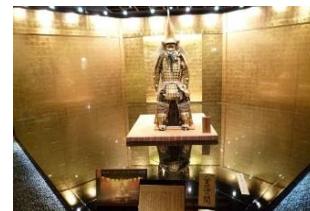
前田利家公珍藏的黃金戰衣

您知道嘛？如今日本 99% 的金箔都來自於金澤，今次帶大家去箔巧館了解金澤名產的金箔。箔巧館是以「金澤金箔」為主題的設施，剛剛翻新完畢，在此可以參觀金澤金箔的歷史、文化、製作工程，甚至能欣賞到古人前田利家公珍藏的黃金戰衣！此外也展示販賣金箔的工藝品、化妝品與食品等等，更可自行參加各式各樣金箔的體驗！