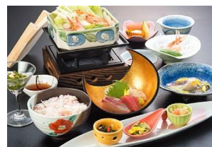
海鮮御膳 ※圖片只供參考

由於富山縣臨近富山灣，富山縣地域的海鮮均新鮮美味，種類繁多，再加上使用昆布及富山縣產的越光大米做出的飯特別香糯，粒粒分明。加上鮮美海鮮，特別滋味！