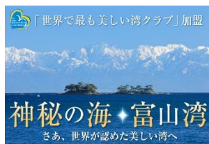
最美麗海灣【富山灣】

特地安排前往海王丸公園，眺望高46米的巨型帆船海王丸號以及這個最美麗海灣的景色，如天氣晴朗，更能欣賞立山黑部連峰的絕景！