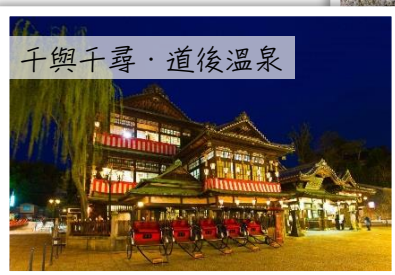
千與千尋・道後溫泉