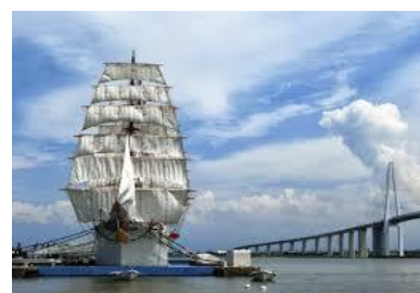
46 米的巨型帆船【海王丸號】