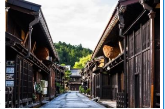
飛驒高山・上三之町

飛驒高山位於岐阜縣北部，有「飛驒小京都」之稱，這裡保留了 400 年前的古 老街道，有許多江戶時代的傳統建築，沿路味噌店、雜貨店、咖啡廳、餐廳、紀念品店等現代商店林立，但絲毫不損老街的歷史風情。沿路有不少 路邊小攤，例如飛驒牛烤肉串、飛驒牛肉包、飛驒牛肉壽司、五平餅、雪糕等等，可品嚐到飛驒高山的地道風味。