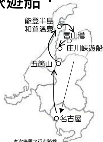
本次旅程之行走路線