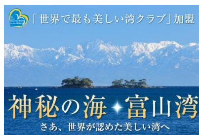
46 米的巨型帆船【海王丸號】