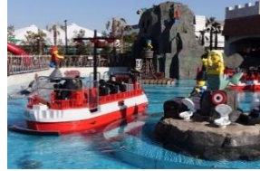
海盜區 - 大水戰