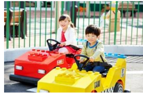
LEGO City - 考車牌

全球首個 LEGOLAND 的 Bricktopia 園區，設全球最新遊戲設施「貓捉老鼠」，需兩人合力拉下繩索，把自己升上塔頂，再緩緩降下，似足慢版跳樓機。