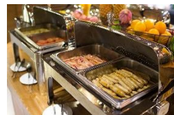
全程於酒店內享用自助早餐