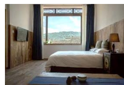
千島湖文淵獅城藝宿

安排於上海、千島湖文淵獅城、杭州、無錫各地優質住宿，地理位置優越，方便行程安排，又有多樣休閒設施，讓各位享受悠閒假期。大部分酒店於客房及公共空間提供免費 wifi，讓您與親友聯絡，分享旅程樂事。